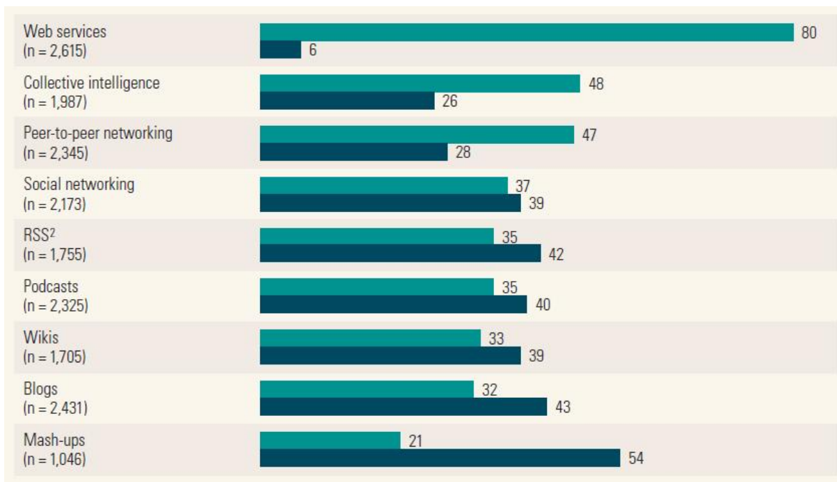
Figura 1 – Web 2.0 Planning for technologies and tools