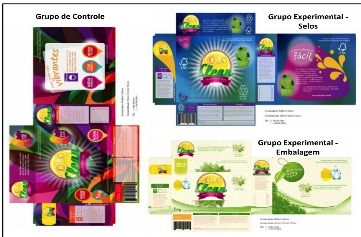
Figura 2 - Embalagens utilizadas

estruturado em torno de duas escalas. Para a avaliação da identidade corporativa, utilizou-se a escala adaptada do estudo de Ahearne, Bhattacharya e Gruen (2005), composta por quatro itens. A segunda escala, referente à propensão de compra, foi adaptada do estudo de Baker e Churchill (1977), composta por três itens. Os constructos foram mensurados através de escalas do tipo de Likert de cinco pontos. Convém ressaltar que foi realizado um pré-teste do instrumento de pesquisa, visando a uma melhor adaptação deste ao contexto estudado, além de verificar se as questões eram compreensíveis aos pesquisados. Além disso, durante o pré-teste, questionou-se aos entrevistados quais eram suas impressões acerca da embalagem recebida, a fim de verificar se seriam necessárias modificações na arte das embalagens. Para a análise dos resultados, utilizou-se o software Statistical Package for Social Sciences (SPSS 17.0), no qual foram realizados os testes de média, desvio padrão, mediana, análise fatorial, coeficiente Alpha de Cronbach e análise de variâncias, tratados detalhadamente na seção de resultados.