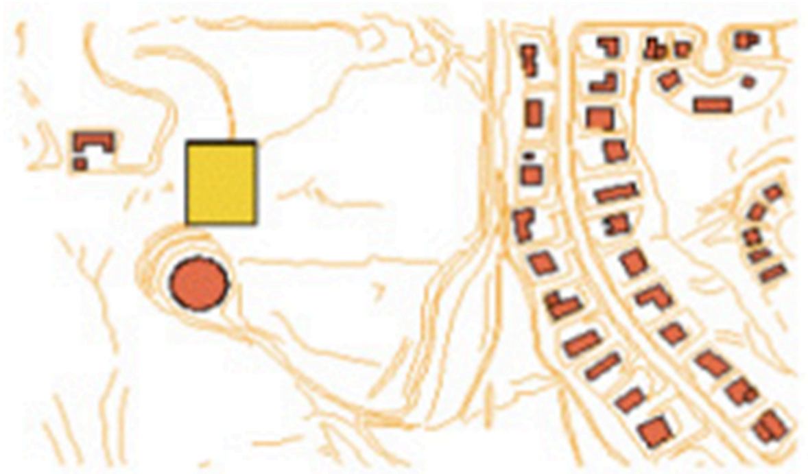
Figura 1 - Níveis temáticos de construções (polígonos) e de estradas (linhas) representados em uma mapa 2D.