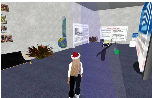
Figura 4. Ambiente CONTRA

O ambiente CONTRA teve o papel de reportar todas as informações contrárias ao REUNI, questionando suas propostas, metas e diretrizes idealistas e muitas vezes pouco ajustadas à realidade atual das Universidades Federais. O foco deste espaço era passar aos visitantes a ideia de que a reestruturação das Universidades Federais seria, futuramente, mais prejudicial do que vantajosa para o ensino superior das entidades federais. A Figura 4 mostra uma imagem referente ao ambiente CONTRA.