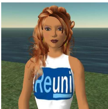
Figura 1. Avatar criado no Second Life

Segundo Patriota e Oliveira (2007), no mundo do Second Life as possibilidades são quase ilimitadas. Os usuários são denominados de residentes ou habitantes e têm autonomia para fazer o que quiserem na hora que lhes convém. T tamanha liberdade é vivenciada pelos residentes através de um avatar, conforme apresentado na Figura 1, uma representação digital do ser humano que deve ser criada nos primeiros instantes de “vida” no mundo paralelo.