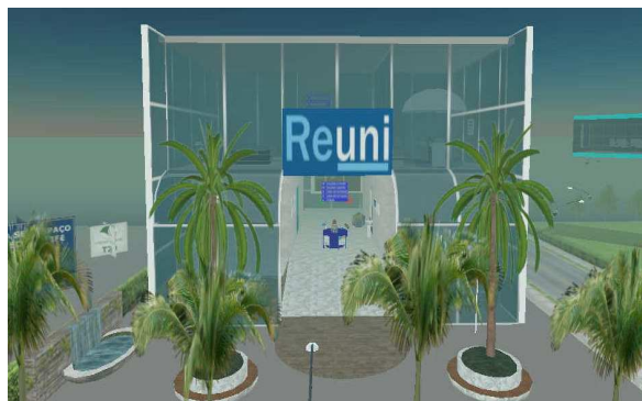
Figura 2. Prédio do REUNI na Ilha BRASIL SUL

As informações sobre o REUNI foram repassadas aos usuários utilizando os mais diversos meios de interação, como cartazes, murais, músicas, imagens, folders, enquetes, fóruns virtuais de discussão, charges e jogo sobre as propostas do projeto. A Figura 2 apresenta o prédio do Espaço REUNI.