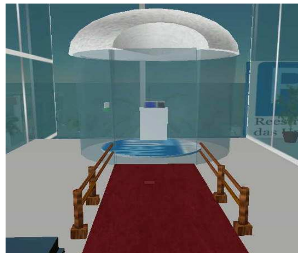
Figura 5. Cabine de votação

Na recepção, o avatar pode solicitar a ajuda da atendente ou simplesmente pegar a senha para assim dirigir-se à cabine de votação. Se a cabine estiver ocupada, a senha não é entregue, o avatar deve aguardar a cabine ser desocupada. Caso a cabine esteja livre, o avatar receberá a senha e poderá se dirigir a ela para votar. Após pegar a senha o avatar tem setenta segundos para votar, senão sua senha expira e será necessário solicitar outra senha. A porta da cabine só abre se a cabine estiver desocupada. A Figura 5 apresenta o ambiente de votação.